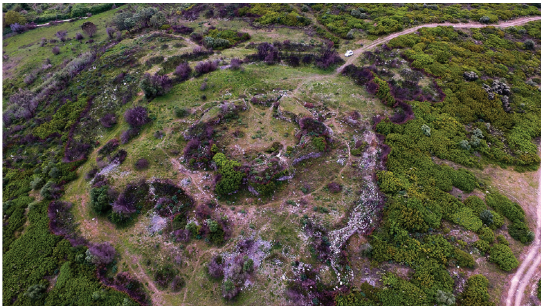
Figura 1 – Vista geral de Vila Nova de São Pedro – Abril de 2017.