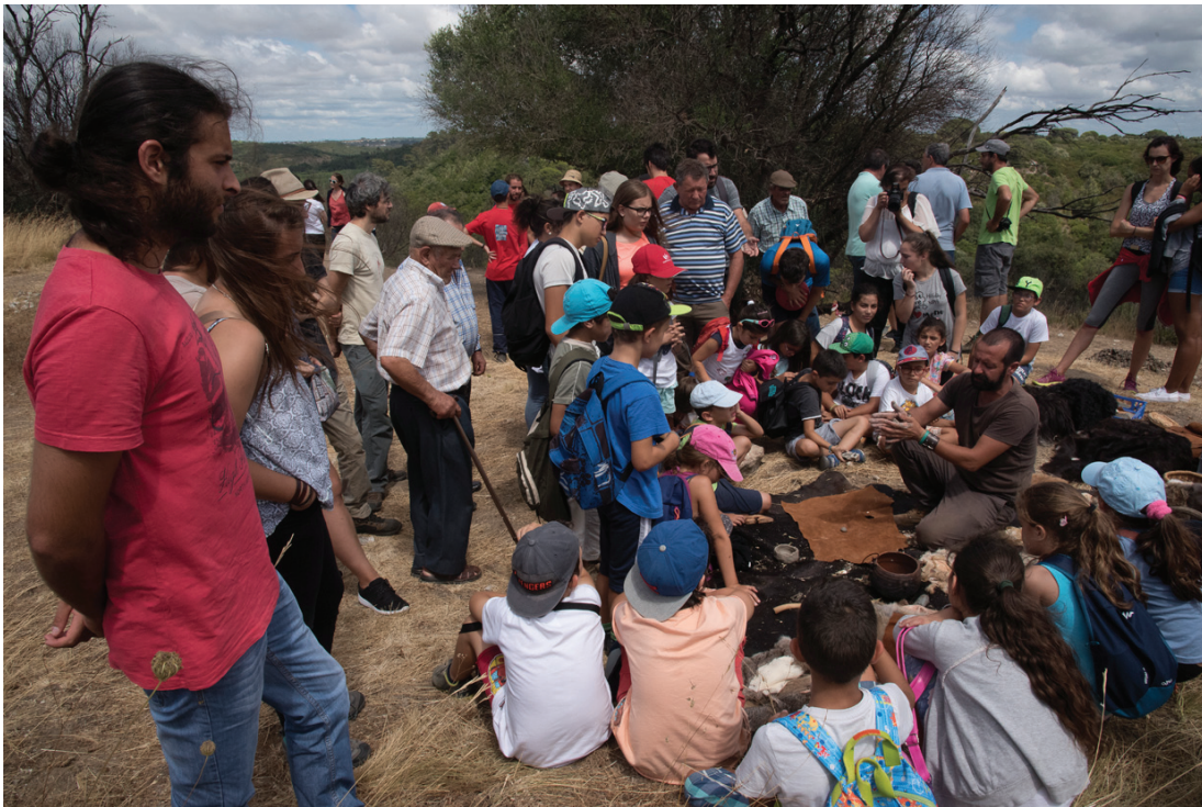
Figura 4 – Dia Aberto VN3000 – 19 de Julho de 2017 – imagem do atelier de arqueologia experimental.