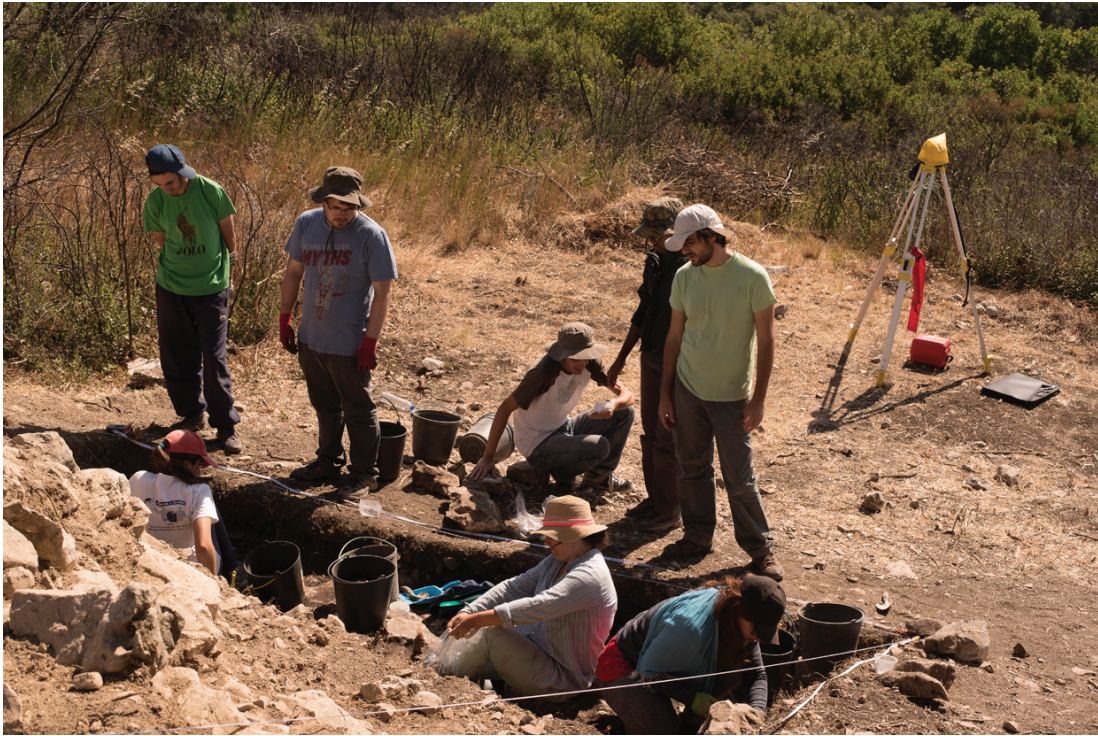
Figura 6 – Aspecto dos trabalhos de escavação realizados em 2017.