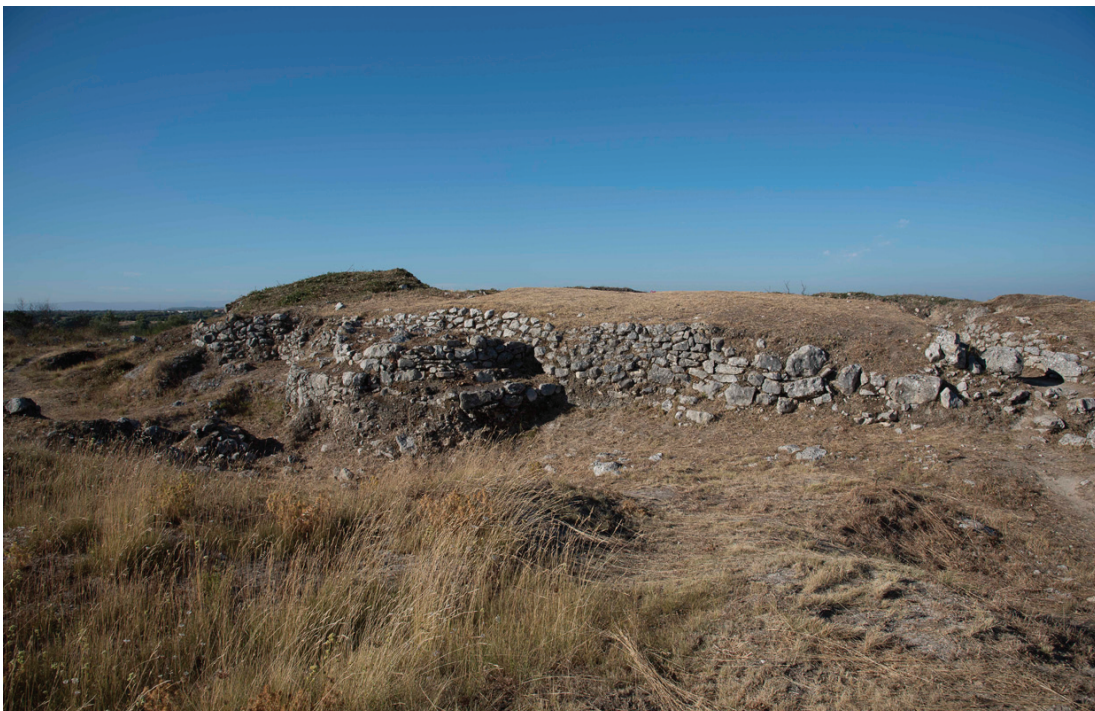
Figura 5 – Muralha central de Vila Nova de São Pedro.