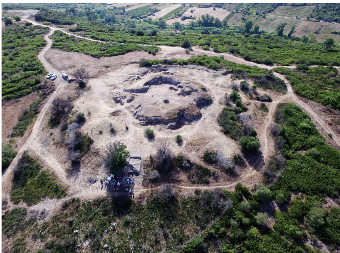
Figura 2 – Vista geral de Vila Nova de São Pedro – Julho de 2017, após a limpeza e desmatamento.